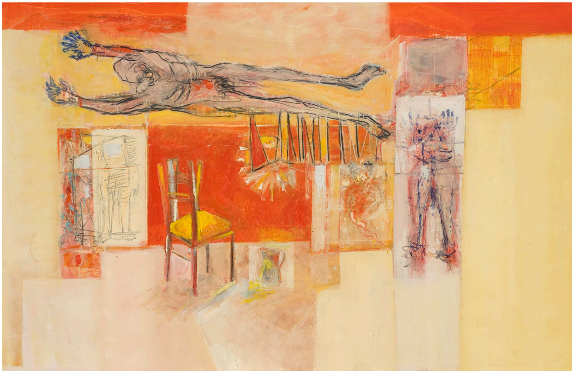
Sueño de una madrugada de invierno, óleo sobre tela, 195 x 300 cm. 2008