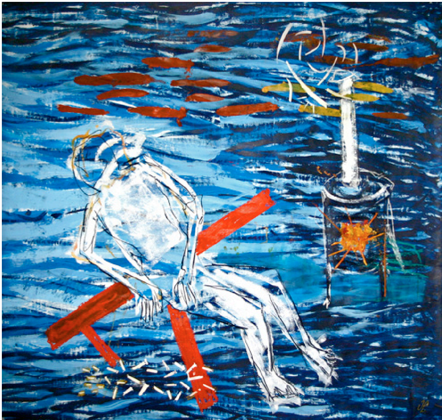
Sin título, técnica mixta sobre papel, 147 x 139 cm. 2007