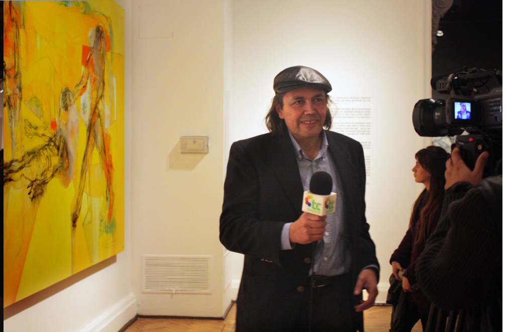
Museo Nacional de Bellas Artes, "Yo Pintor", 2 de junio de 2009