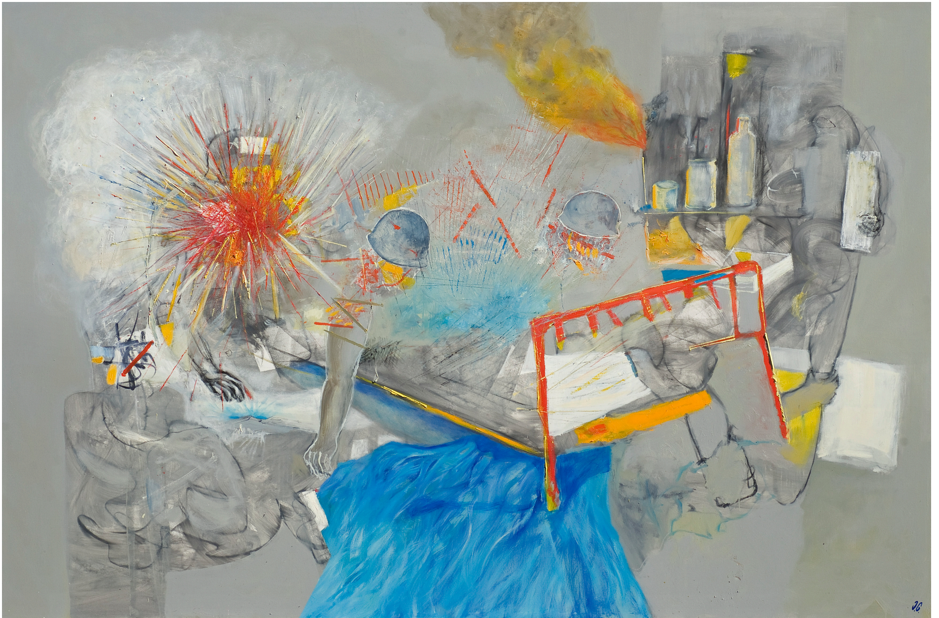
War, óleo sobre tela, 200 x 300 cm. 2008