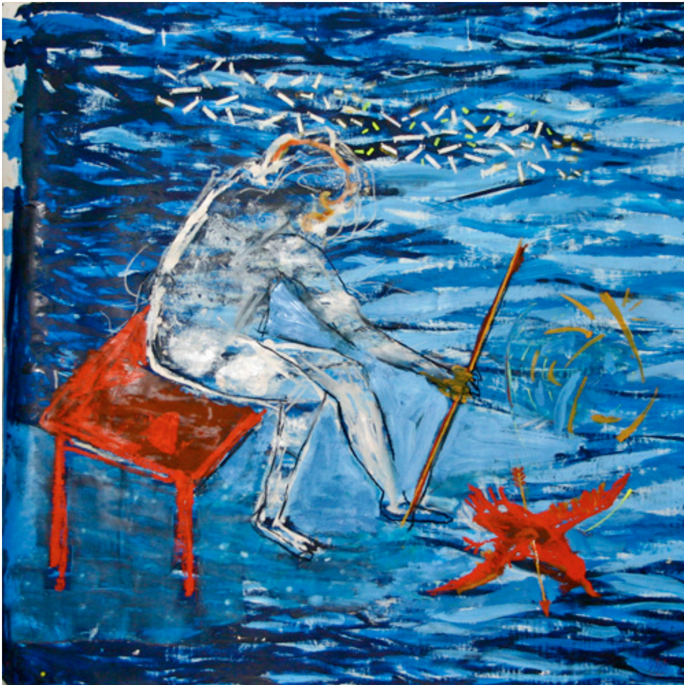
Sin título, técnica mixta sobre papel, 139 x 136 cm. 2007