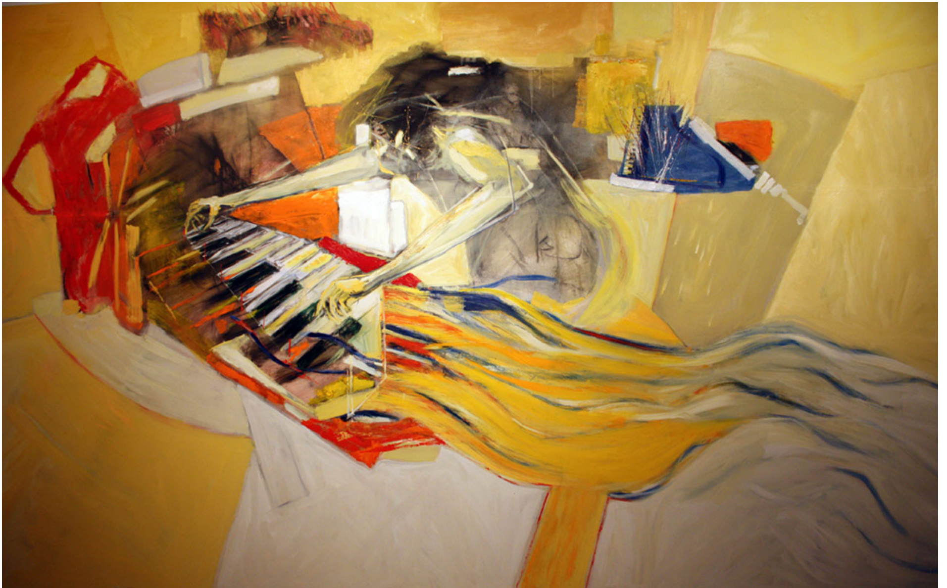
Fuga, óleo sobre tela, 300 x 400 cm. 2008