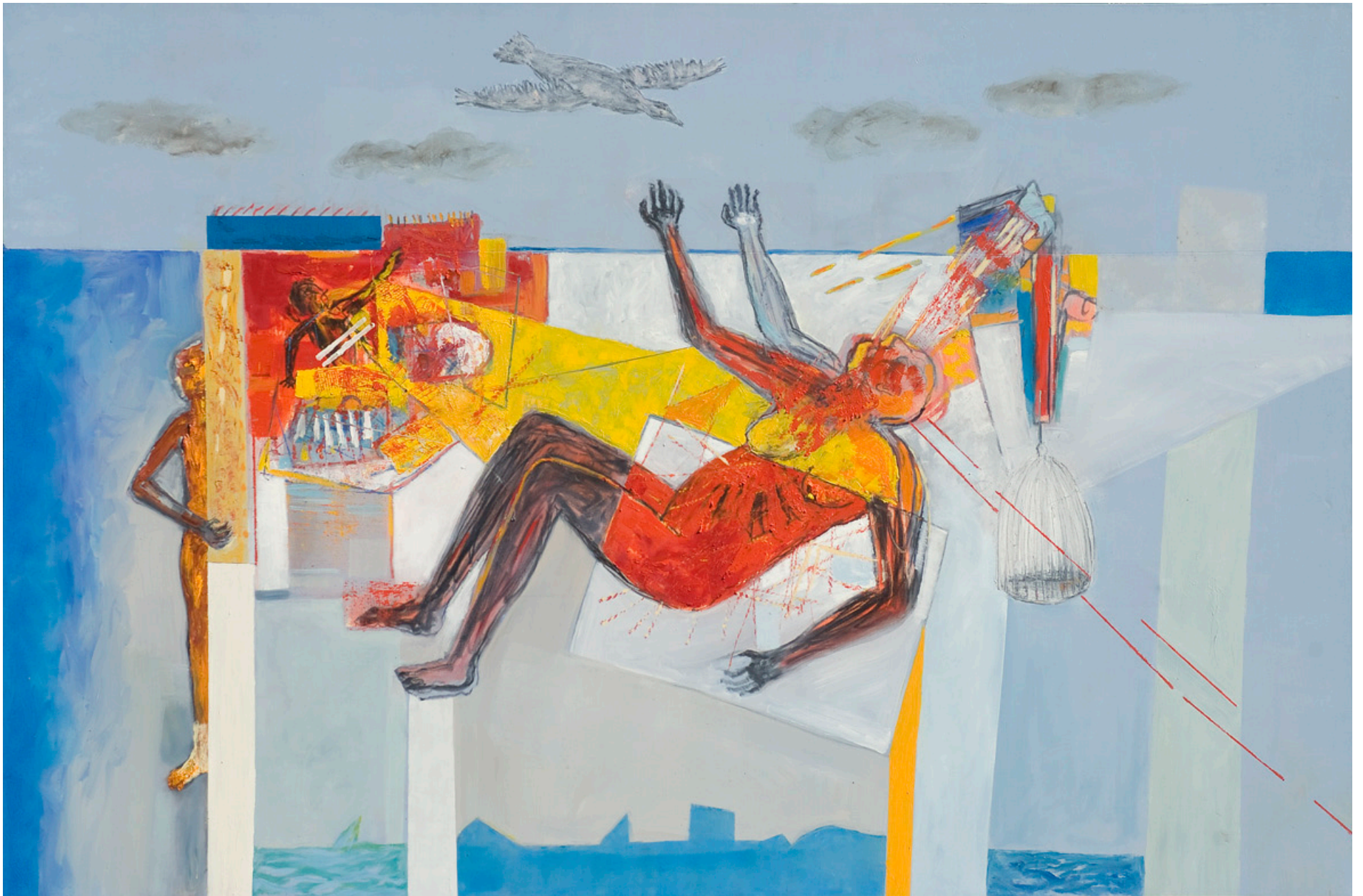
Visión de una infancia lejana, óleo sobre tela, 200 x 300 cm. 2008