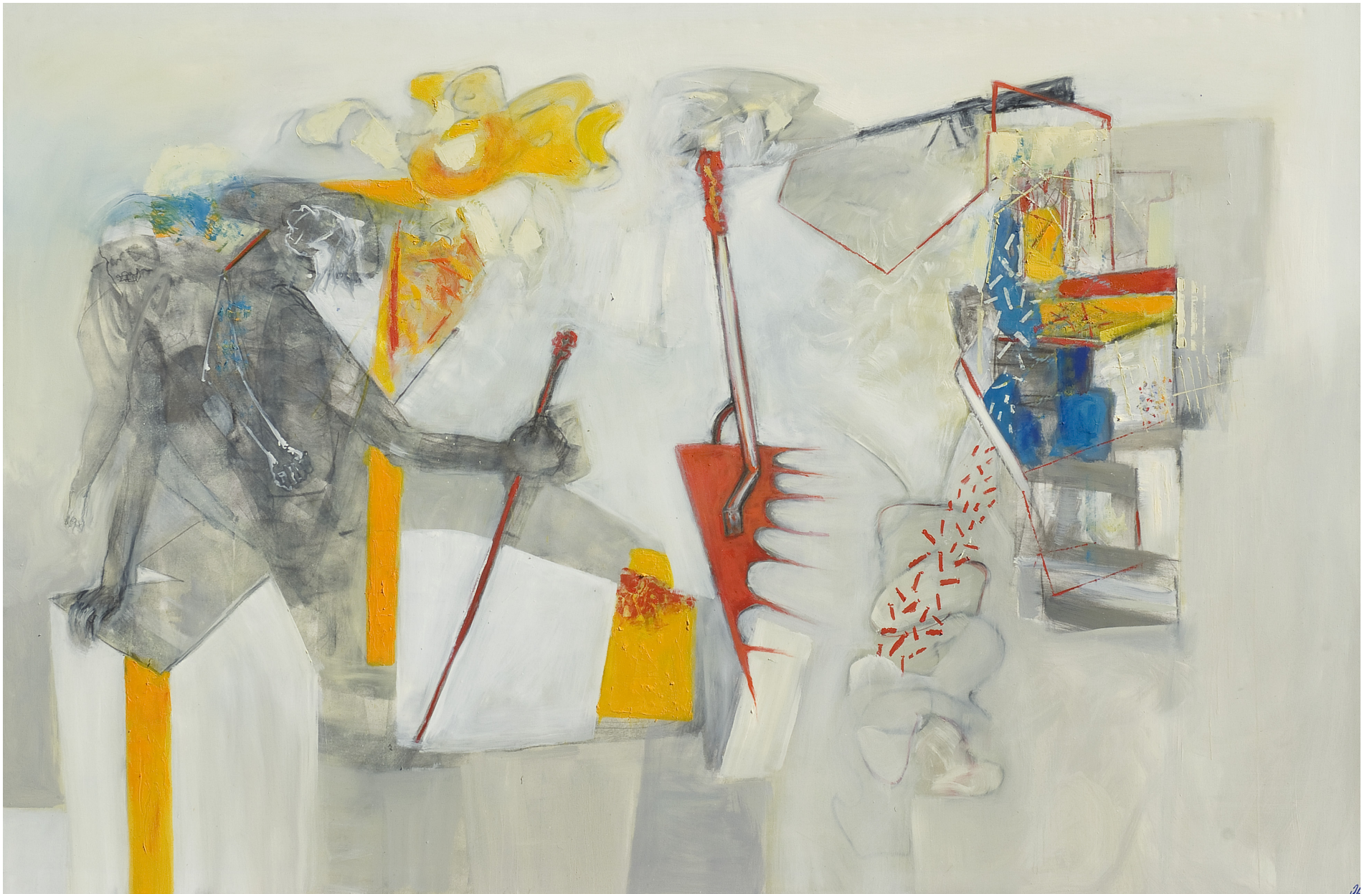
Constitución voraz, óleo sobre tela, 200 x 300 cm. 2008