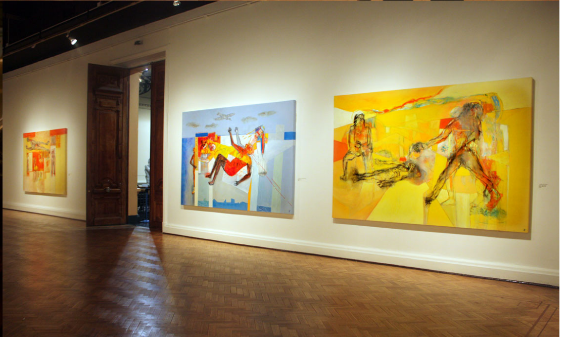
Museo Nacional de Bellas Artes, "Yo Pintor", 2 de junio de 2009