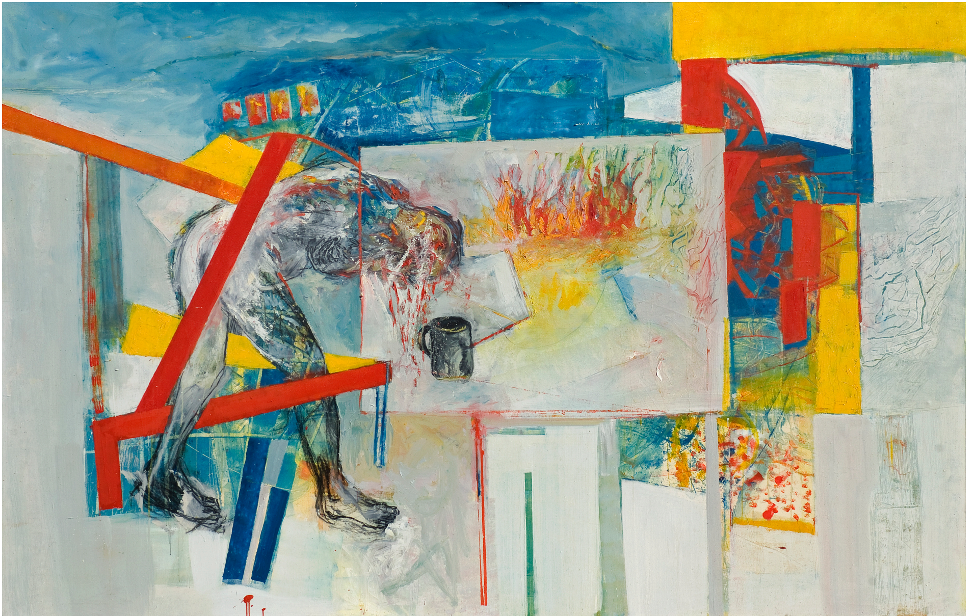
Unos minutos antes de crear, óleo sobre tela, 180 x 280 cm. 2008