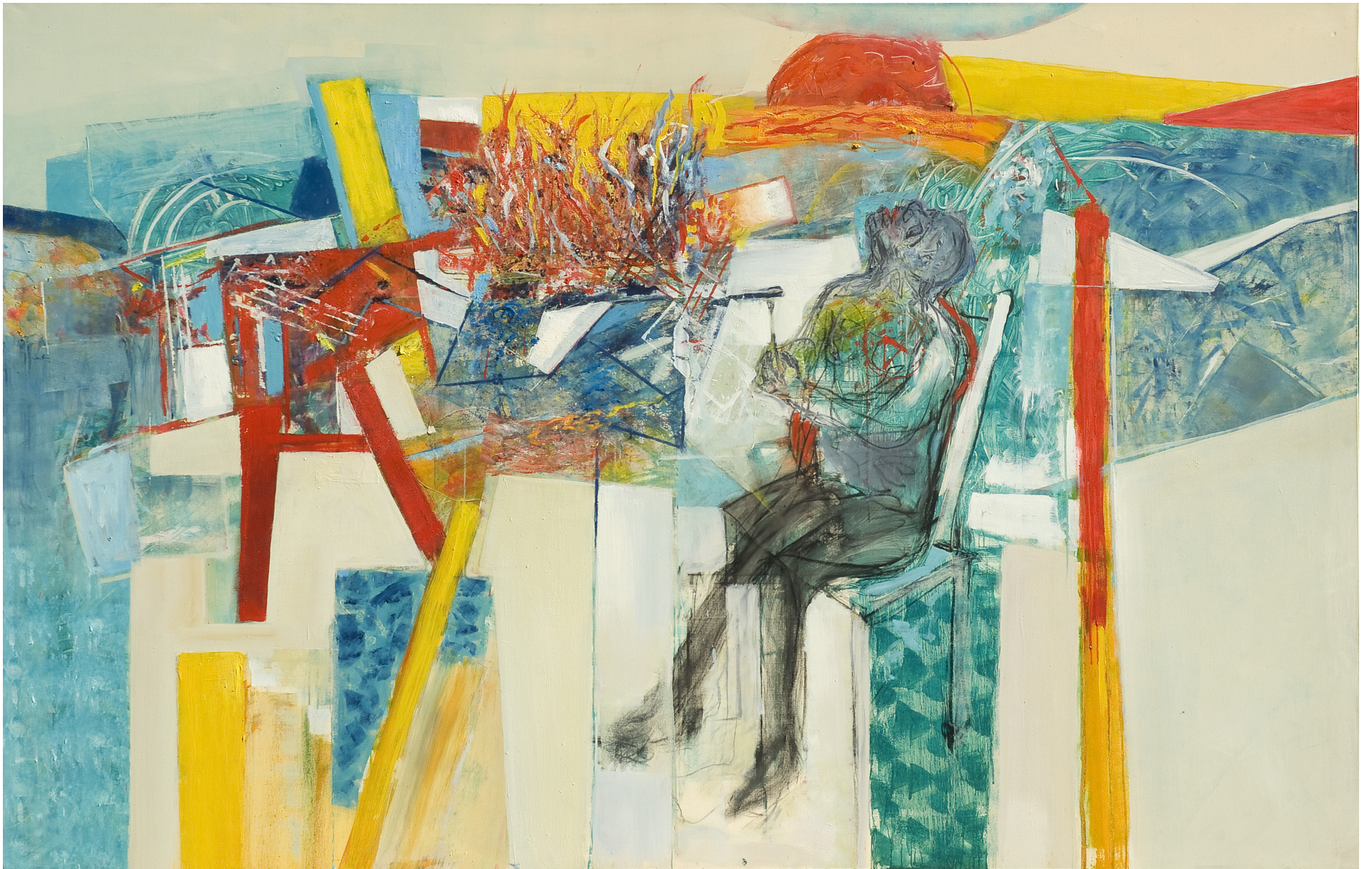
Oración desde la otra orilla, óleo sobre tela, 180 x 280 cm. 2008