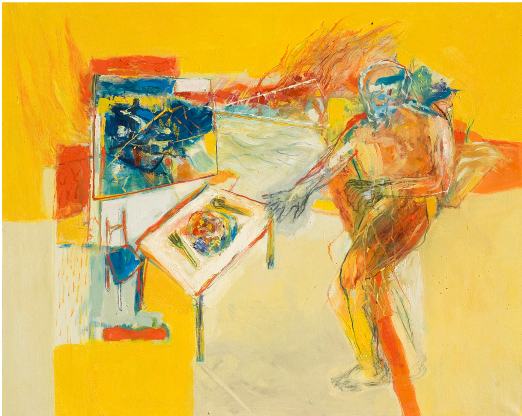
Hora santa, óleo sobre tela, 160 x 200 cm. 2008