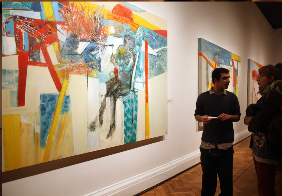
Museo Nacional de Bellas Artes, "Yo Pintor", 2 de junio de 2009