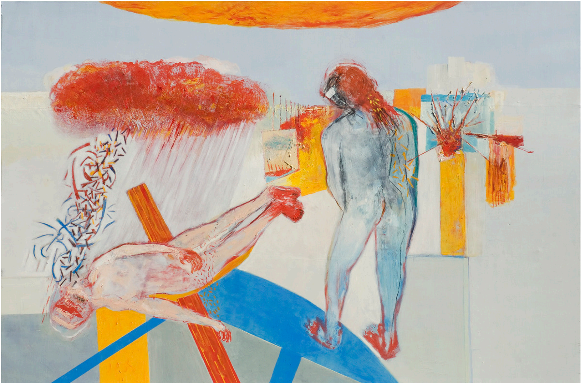
Final de un salmo ajeno, óleo sobre tela, 200 x 300 cm. 2008