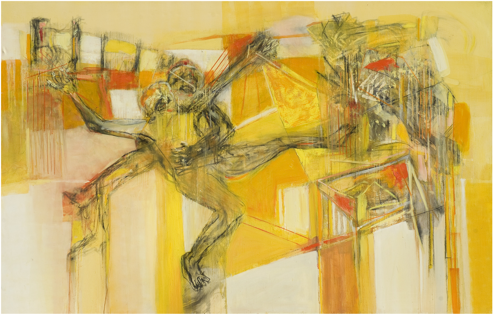
Rapto, óleo sobre tela, 180 x 280 cm. 2008