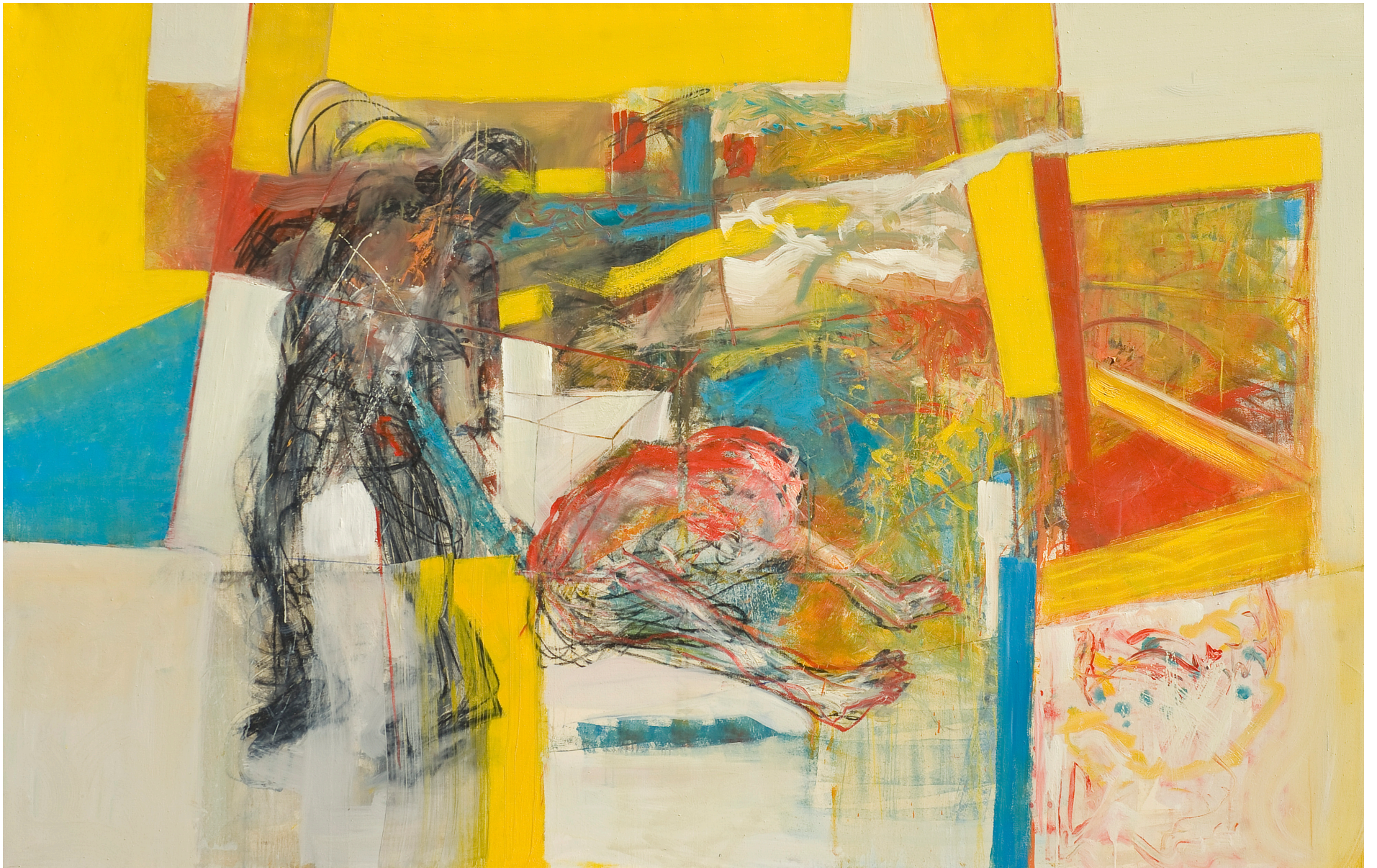
Bajo Vigilancia, óleo sobre tela, 180 x 280 cm. 2008