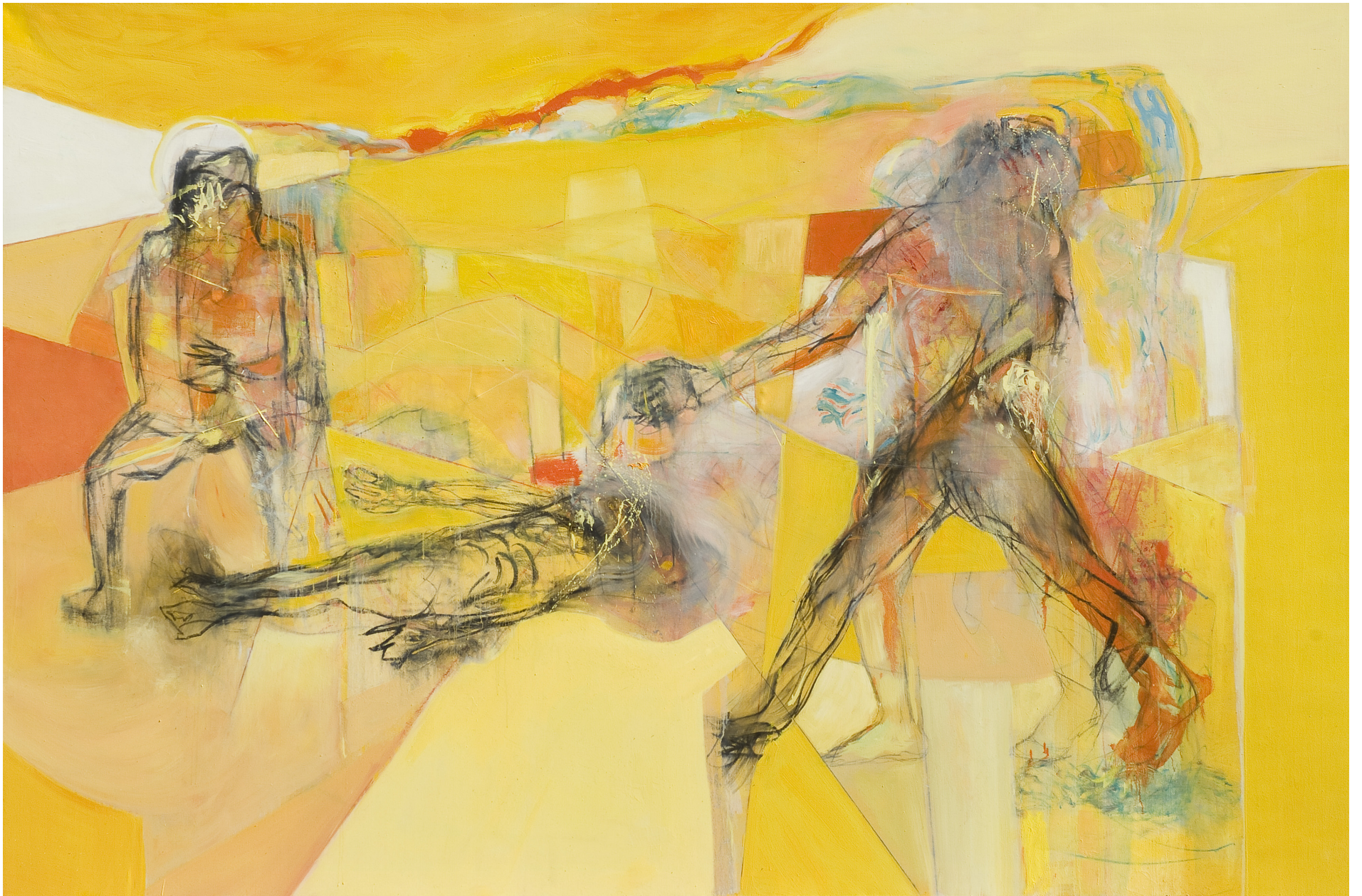
Tiempo de callar, óleo sobre tela, 200 x 300 cm. 2008