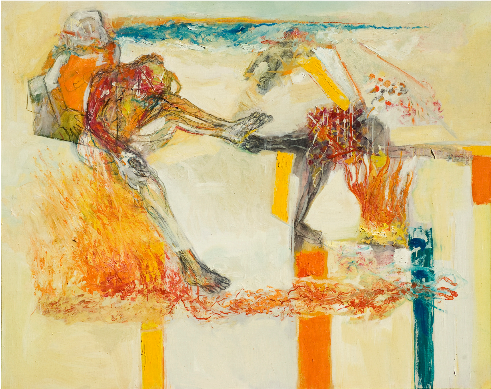
Ilusión, óleo sobre tela, 160 x 200 cm. 2008