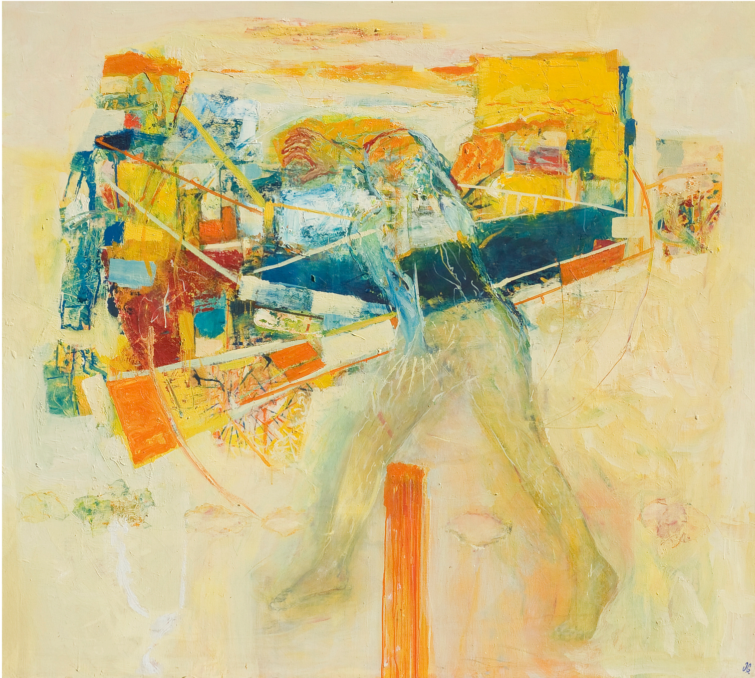
Imposibilidad de un ciudadano, óleo sobre tela, 180 x 200 cm. 2008